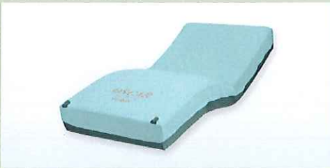
オスカー <モルテン>