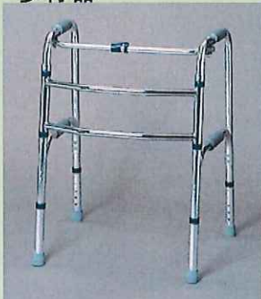
交互式歩行器 <イーストアイ>