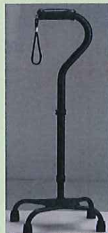
四点杖 <松永製作所>