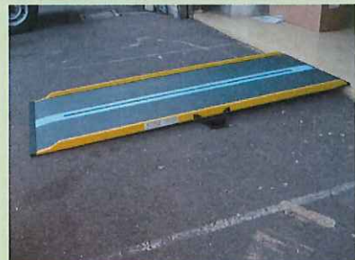
ダンスロープライト <ダンロップホームプロダクツ>