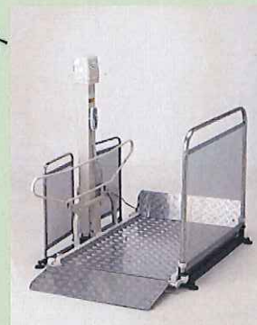
車イス用電動昇降機 <いうら>