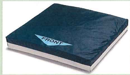
Gel-Tクッション <ケーブ>