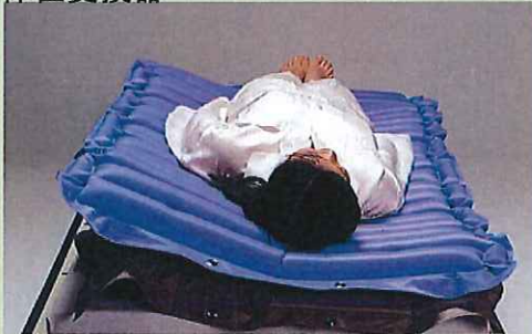
スーパー介助マットk02 <モルテン>