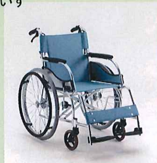
エアリアル(自走式) <松永製作所>