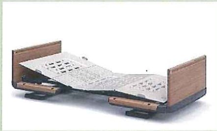
楽匠Z <パラマウント>