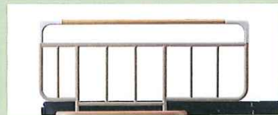
ベッドサイドレール <パラマウント>